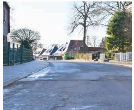
Hier geht es im September los mit dem Bau von Straße, Nebenanlagen sowie Straßenbeleuchtung.

Außerdem wurde die Reparatur der gepflasterten Entwässerungsrinne