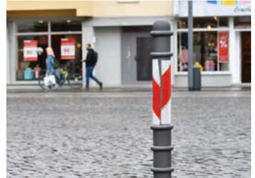
Auch auf dem Brunnenplatz verhindert jetzt ein Poller die Einfahrt.

Vorrang gegenüber den Radfahrern. Durch die Stadt wurden an mehreren Stellen nun Verkehrsposten (Poller) angebracht, um das Einfahren in die Fußgängerzone zu verhindern. Ausnahmen von diesem Fahrverbot