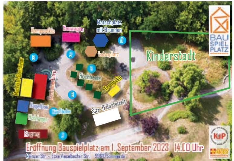
Das Gelände des Bauspielplatzes von oben gesehen. Farblich gekennzeichnet sind die unterschiedlichen Bereiche, die es auf dem Areal gibt. Rechts entsteht die Kinderstadt.